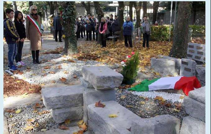
NUOVO MONUMENTO E' presente nel viale del cimitero