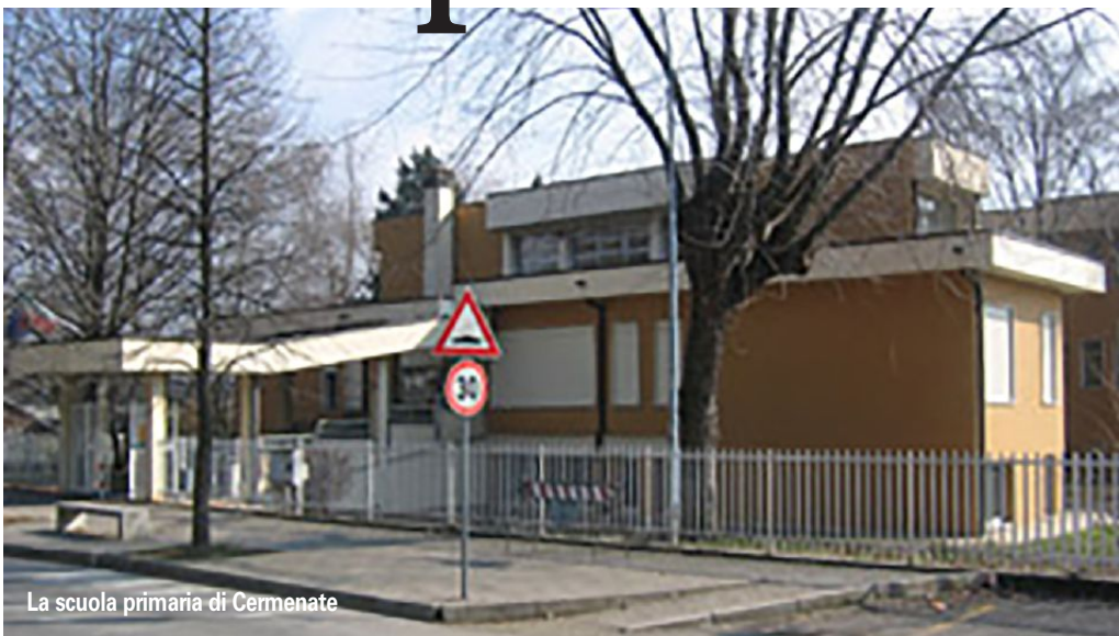
La scuola primaria di Cermenate

Una gara tra gli alunni della scuola elementare per insegnare che non va bene sprecare gli alimenti: qualcuno però prende la «battaglia» troppo sul serio e mangia più del dovuto e sta male in mensa, rimettendo tutto quello che aveva ingerito